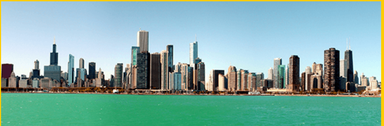
na zdjęciu: panorama Chicago

Wszystkie wieżowce są więc wysokościowcami, lecz tylko najwyższe wysokościowce są wieżowcami. Za miejsce narodzin drapaczy chmur powszechnie uznaje się Chicago.