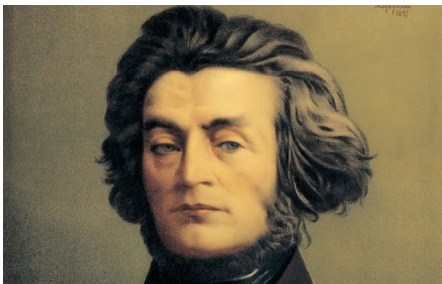
Na zdj. Portret Adama Mickiewicza

Akcja toczy się w Dzień Zaduszny (w nocy) w kaplicy, gdzie zebrała się grupa ludzi z pobliskiej wioski. Trwa ludowy obrzęd Dziadów , któremu przewodniczy Guślarz. Zebrani wzywają kolejno dusze czyścicowe, chcąc ulżyć im w cierpieniu. Na ich wezwanie przybywają trzy rodzaje duchów: lekkie, ciężkie i pośrednie