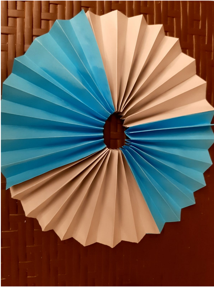
5. I gotowe