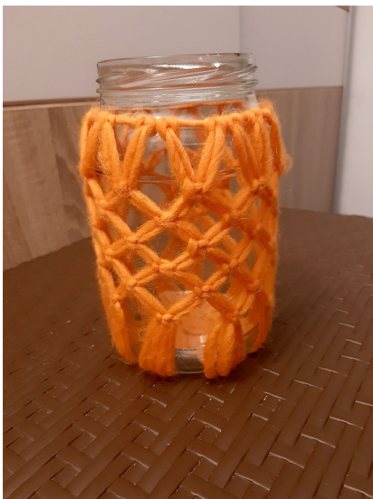
13. Nasz słoik z makramą ładnie będzie wyglądał jako świecznik